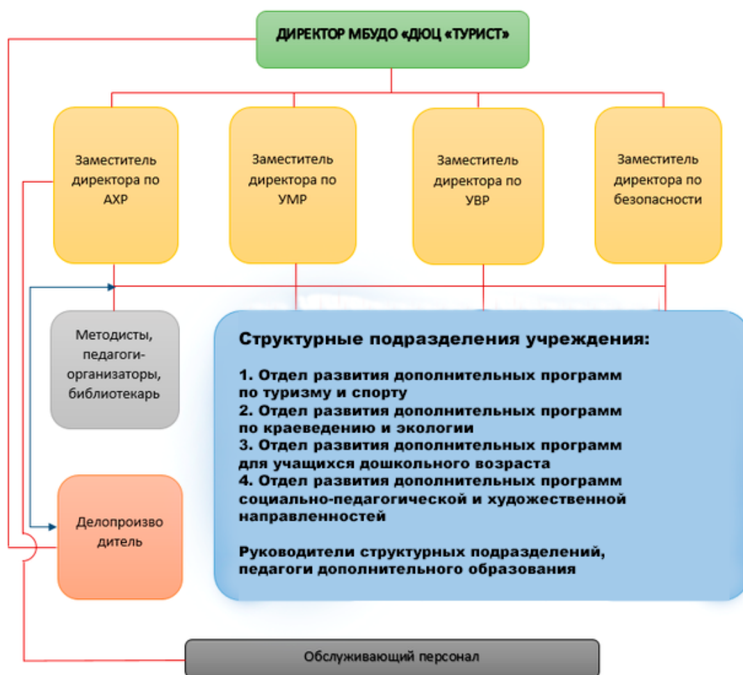
Схема управления МБУДО «ДЮЦ «Турист»

*На схеме показаны основные иерархические связи по должностям в образовательной организации